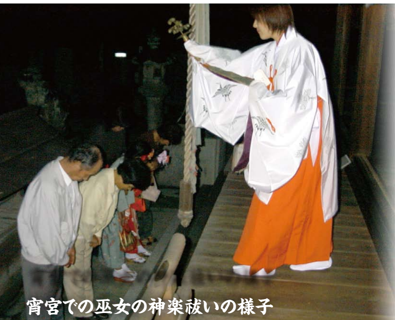
宵宮での巫女の神楽祓いの様子